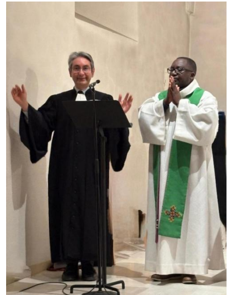
à l'église de Loisin

Préparée par l'Église apostolique arménienne, cette célébration est une adaptation de l'office du lever du Soleil, prière de l'Église Arménienne instituée par le grand catholicos saint Nersès dans le but de ramener une secte de païens adorateurs du soleil (1 er siècle après JC).