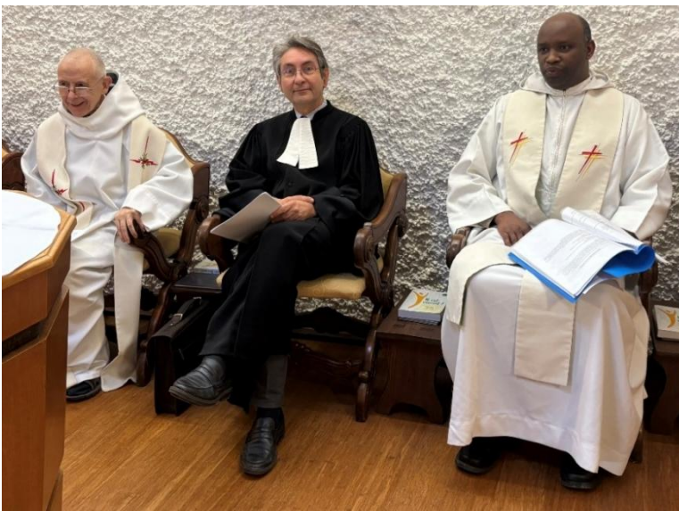
au prieuré d'Evian